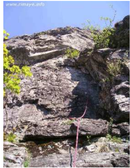
Le dièdre du départ de L1

Très belle voie, une réussite. Comme partout aux Rochers de l'Homme, l'exposition permet de grimper au printemps et à l'automne.