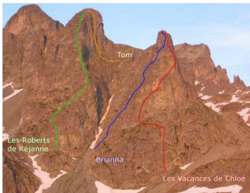
Vue générale du secteur des Vans

L7: Longueur commune à "Vacances de Chloé", corde tendu.