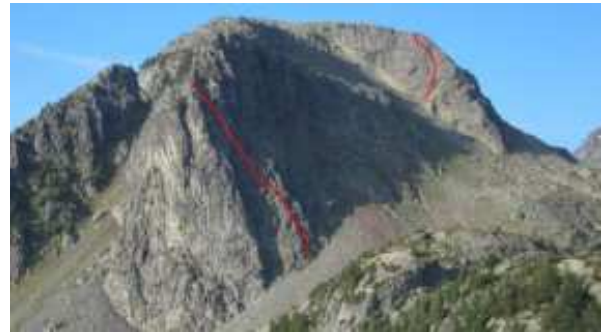
La voie vue depuis la Brèche Robert Sud

Un petit campement aux Lacs est le bienvenu pour profiter de ce secteur bien équipé et d'un niveau abordable pour les grimpeurs voulant s'initier à la grande voie.